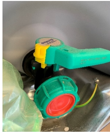
Zustand und Bedienungsausrüstung