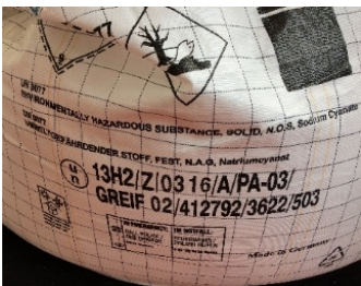
Herstellungs- und Konformitätskennzeichen