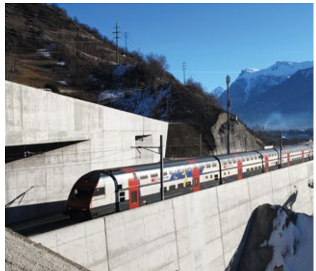
Der Lötschberg-Basistunnel verkürzt die Reisezeiten zwischen Nord und Süd.

Der Lötschberg-Basistunnel mit einer Länge von 34,6 km wurde am 9. Dezember 2007 in Betrieb genommen. Der Bau dauerte acht Jahre. Diese kurze Bauzeit war möglich, da die Arbeiten von fünf verschiedenen Baustellen aus gleichzeitig vorangetrieben wurden. Zeitweise waren bis zu 2500 Personen gleichzeitig an der Realisierung des 5,3 Milliarden Franken (rund 5 Mrd. Euro; heutige Preise,