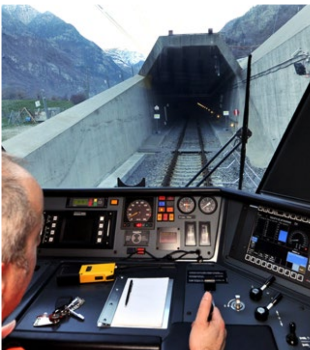
Der Gotthard-Basistunnel ist der längste Eisenbahntunnel der Welt.

Der 15,4 km lange Ceneri-Basistunnel im Tessin komplettiert die Gotthard-Achse. Er kostet 3,6 Milliarden Franken (rund 3,3 Mrd. Euro; heutige Preise, inkl. Zinsen und Mehrwertsteuer) und geht 2020 in Betrieb. Mit den Basistunnels am Gotthard und Ceneri werden sich die Fahrzeiten von Zürich nach Mailand auf rund drei Stunden verkürzen. Der Ceneri-Basistunnel wird zudem das regionale Bahnnetz im Tessin durch kürzere Reisezeiten und bessere Verbindungen attraktiver machen.