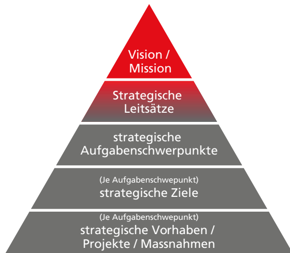
Abb. 1: Aufbau der Strategie BAV